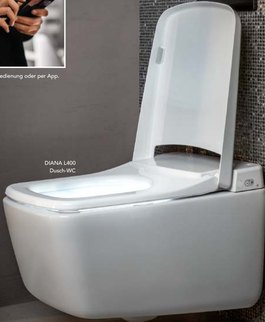
DIANA L400 Dusch-WC

In jedem Fall smart zu steuern: mit Fernbedienung oder per App.