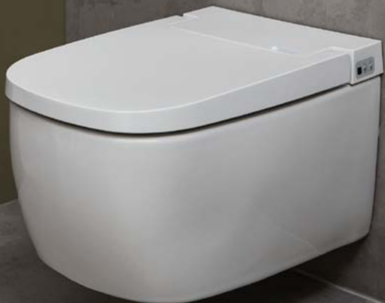
DIANA L200 Dusch-WC Comfort 1.1

Entdecken Sie die Vielfalt der DIANA Badwelten. www.diana-bad.de/badwelten