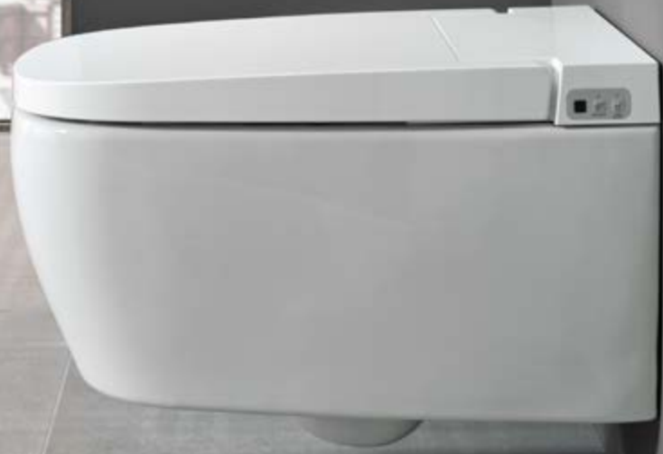
DIANA L100 Dusch-WC Basic 1.1